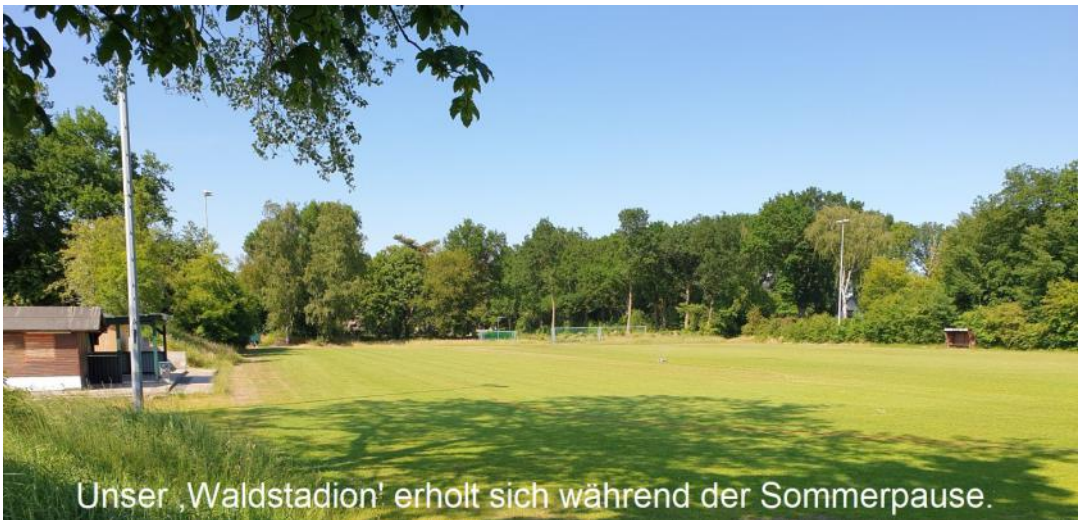
Unser ‚Waldstadion‘ erholt sich während der Sommerpause.

[Gründungsmitglied der Fußballsparte des SV Hörnerkirchen im Jahre 1959 (damals unter ‚Sport-Club Grün-Weiß Bokel‘, der 1956 zunächst als reiner Tischtennisverein gegründet wurde; Fusion zum SV Hörnerkirchen am 1. Juli 2001)]